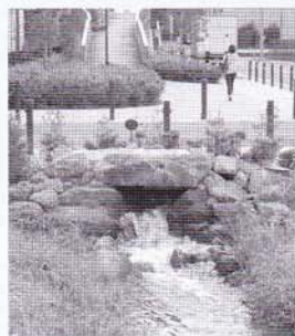
復原された野火止用水

この看板を右折し、直売センターに入ると、採れたての新座産野菜が所狭しと並んでいます。直売所を出て左には野火止用水の一部が復原され、その流れを